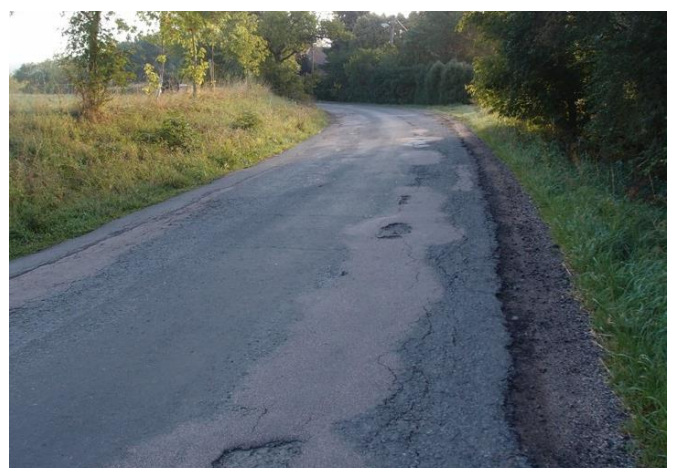
Stovky metrů silnice s nezpevněnou krajnicí, široké pásy, nebezpečných zejména při vyhýbání 2 vozidel.