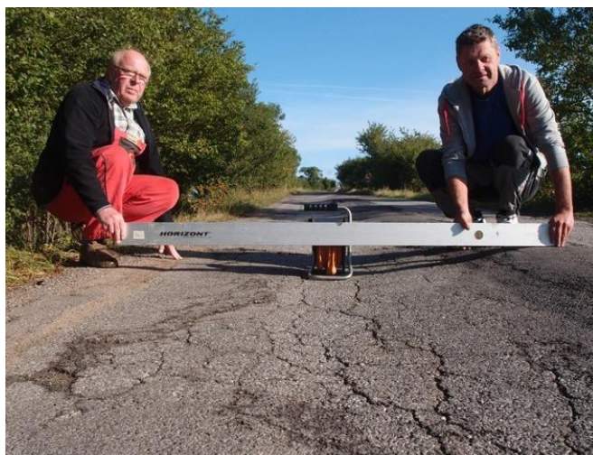
Stovky metrů silnice s nebezpečně hlubokými vyježděnými pásy po obou stranách vozovky.