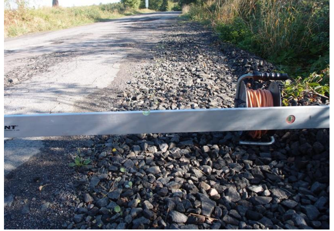
Stovky metrů silnice s krajnicí nebezpečně svažující se k příkopu a nekvalitní minulé opravy silnice.