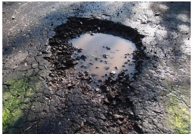
Desítky velkých i menších i hlubokých nebezpečných vytlučených děr po obou stranách vozovky.