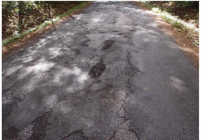
Stovky metrů popraskané vozovky (brzy nové díry), celé úseky vozovky se „záplatami“ jedna vedle druhé.