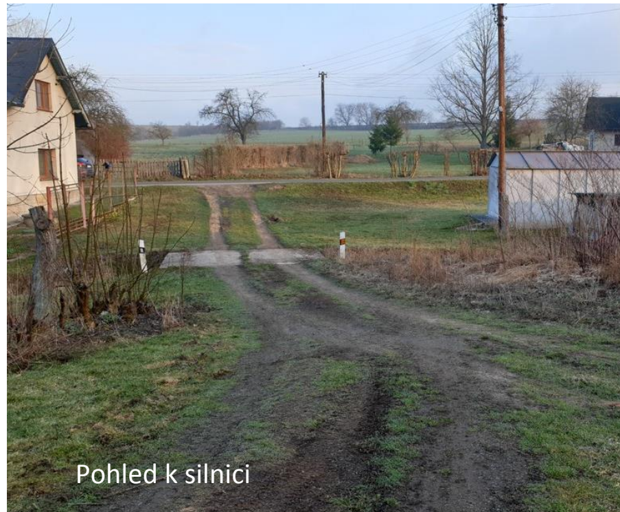
Pohled k silnici