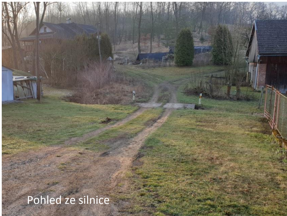
Pohled ze silnice