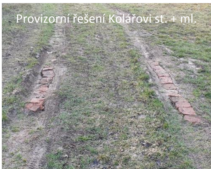
Provizorní řešení Kolářovi st. + ml.