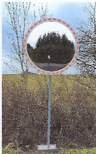
kulaté zrcadlo průměr 120 cm, dodané po VL urgencích, foto z 29. 1. 2020