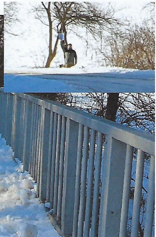
Foto z 31. 01. 2021, ze směru od Újezdu pod Troskami do Semínovy Lhoty