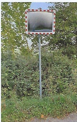
obdélníkové zrcadlo 70 x 90 cm, prvně OÚ dodané, foto z 13. 9. 2019