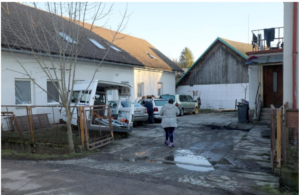
Dům a jeho obyvatelé, kteří leží místním v žaludku.

K domu zrovna přijíždí sanitka a přiváží mladou ženu bez nohy – matku dětí, které na ni čekají uvnitř. „Rakovina,“ říká potichu se slzami v očích její maminka, vnoučata zvědavě vykukují.