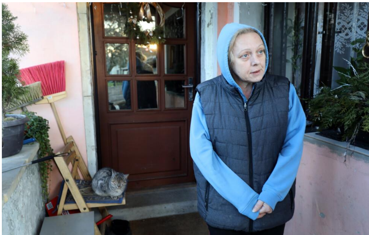
Paní Jitka volila Baštu, protože je vlastenec.

„Bašta by to rozhodně nějak zredukoval, aby tu byly jen maminy s dětmi. Jela jsem jednou vlakem a nastoupilo tam šest mláďat, navoněné, značkové oblečení, a proč my musíme platit jízdné? To je nespravedlivé,“ pokračuje v monologu tradiční volička SPD. „Tohle by se mělo omezit, nějak zredukovat,“ uzavírá vysvětlení, proč svůj hlas dala právě Baštovi.