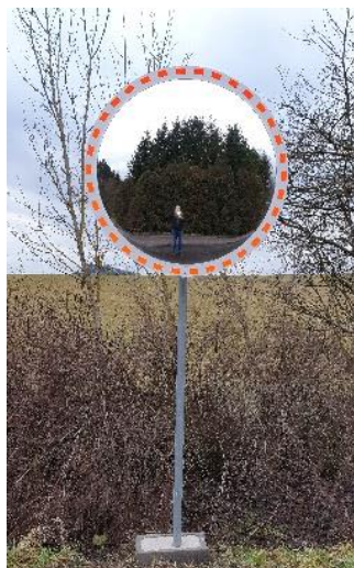
Kulaté zrcadlo průměr 120 cm, dodané OU po VL urgencích, foto z 29. 1. 2020