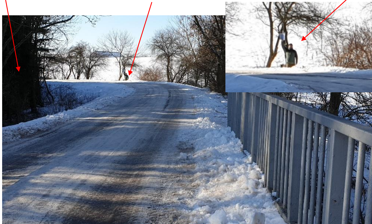
Foto z 31. 01. 2021, ze směru od Újezdu pod Troskami do Semínovy Lhoty