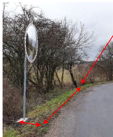
Špatné umístění zrcadla, cca 17 m od vrcholu oblouku zatáčky a cca 1 m od krajnice silnice místo minimálně 2 m jak je v Technické zprávě.

Správné místo instalace zrcadla dle Tech. zprávy.