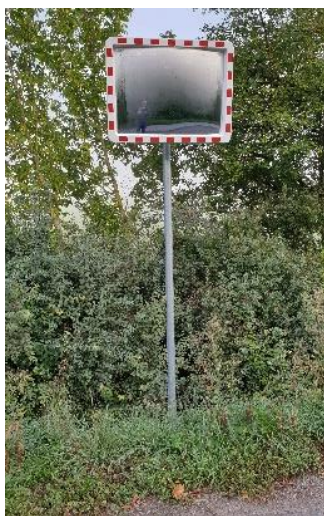
Obdélníkové zrcadlo 70 x 90 cm, prvně OÚ dodané, foto z 13. 9. 2019.