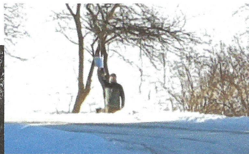
Foto z 31. 01. 2021, ze směru od Újezda pod Troskami do Semínovy Lhoty