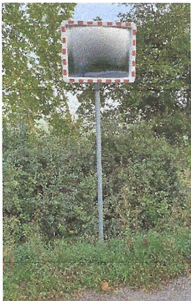
obdélníkové zrcadlo 70 x 90 cm, prvně dodané foto z 13. 9.2019