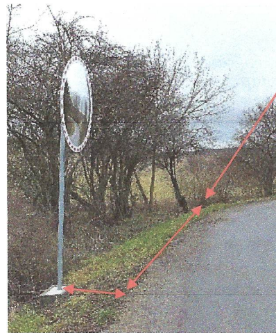
stávající místo, cca 17 m od vrcholu oblouku zatáčky a cca 1 m od krajnice místo min. 2 m jak je v Technické zprávě